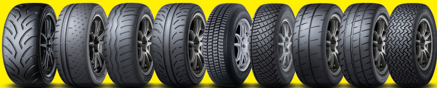
DIREZZA 03G DIREZZA \beta^{02} DIREZZA \beta^{11} DIREZZA ZIII DIREZZA 74R DIREZZA 88R DIREZZA 301R DIREZZA 201R DIREZZA 95R